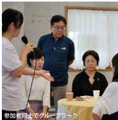
参加者同士でグループワーク

会場では貧困地域に何世代にもわたって続く「貧困の連鎖」をいかに断ち切り、「愛の連鎖」へと変革していくのか、ワークショップを交えて共に考え実践するヒントを見いだすことができ、「サポートしている子どもたちの生活がよくなりました!」との感想や、「愛の連鎖に加わりたい!」と声をあげて新たにサポーターになってくださる