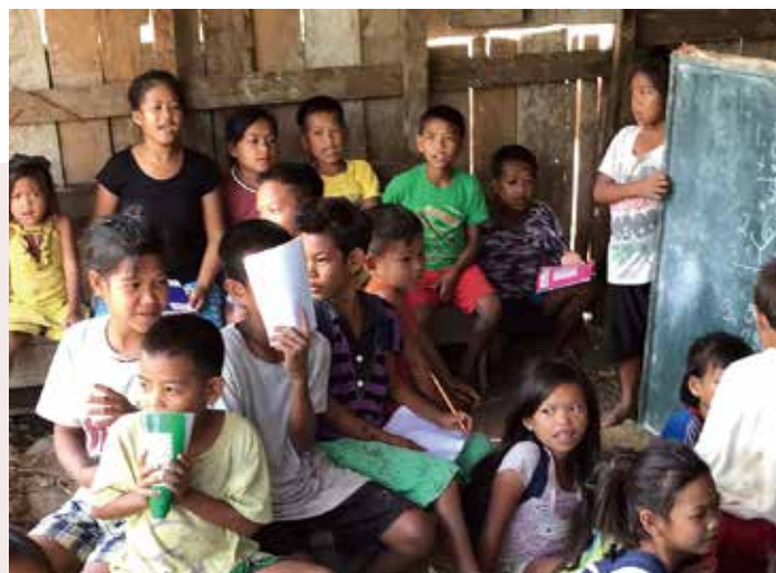
アルサビ村の仮教会で学校を再開