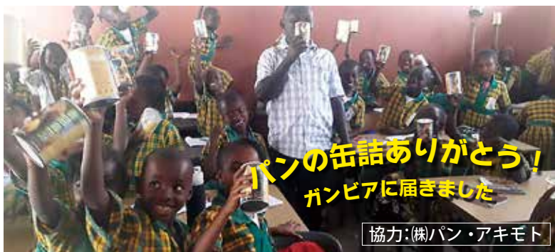
1月号でお知らせしたガンビアに送った「パンの缶詰」(救缶鳥)が子どもたちに届きました!