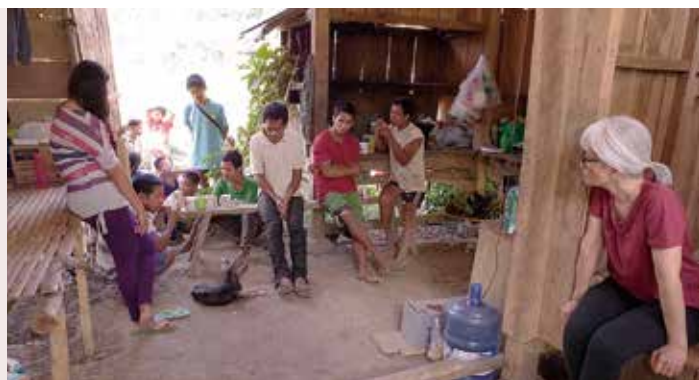
今後の土地取得に向けて話し合うマイの住民

結果として分かったのは「土地の権利を登記している人はいないが、所有権を認められている人がいた。その記録は、1979年にまでさかのぼり、その方はすでに亡くなっている。」権利は血縁者に相続されることになっていて二人の娘さんにその権利があることまで突き止めました。その記録にある人と今の土地の使用者の父親の間で、権利委譲