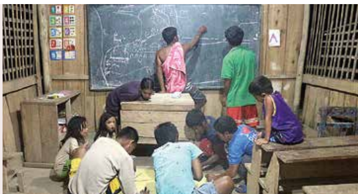
移転のための計画を立てている村のリーダーたち

今まで積極的にコミュニティの問題解決に取り組むことがなかった、十分な教育を受けていないリーダーたちが、相談をしながら解決の方法を考え、問題に取り組んでいることはコミュニティの人々にとって大きな変化です。この変化に他のコミュニティのリーダーたちは驚いています。マイ村のリーダーの行動が実を結ぶことができるよう、続けてご支援いただければ幸いです。