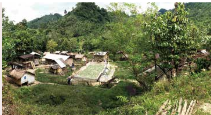
住民がいなくなり建物だけが残るマイ村（※教会堂だけは新村に移設）