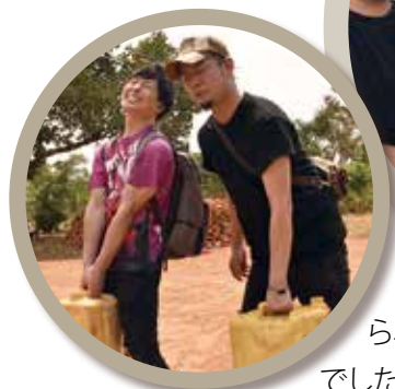
サッカーボール寄贈 &水運び体験

マイナス15度の北海道から30度超えのウガンダへ。飛行機を出た瞬間、寒暖差45度ある乾いた熱気の歓迎を受けたのがウガンダツアーの始まりでした。どこを見ても日本人はおろかアジア人は居ず、まさに異国と言う状況に旅の冒頭か