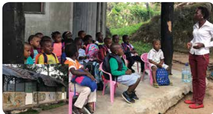
マンゴツリーキッズの園児たちと被害を受けた園舎

もう一つの大きな課題は水です。洪水で人々の貴重な水源が汚染されていて、コレラ感染者は5千人を超えました。コレラは感染すると1、2日以内に死亡するケースも多く、感染率も非常に高い危険な病気です。NGO や自治体職員などが村を巡回して、注意を喚起したり、フィルター付きバケツを配布したりしています。今までどれだけの人々がこれらの村々を巡回して説明したかわかりませんが、洪水の後でさえ、裏庭に掘った穴からコップですくって直に飲んでいました。それを見ると、20年前に駐在していた頃とあまり変化がなく、何を通して人の行動や価値観は本当に変わるのだろうか、と改めて考えさせられます。