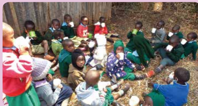
ンチョロイボロ小学校の児童たち

マールイ小学校はケニア山の森林に近く、近隣の農地に水を供給するための水源が利用できる立地で、モデル農園の設立に適しています。カイルニ小学校同様地域住民のほとんどがその日暮らしの農民で、気候変動の影響に対応していない従来型の農法を続けているので生産性は落ちるばかりです。学校にモデル農園ができれば、生徒の保護者をはじめとする地域住民は、気候変動に対応し生産性を上げられる農法を学ぶことができます。マールイ小学校がある