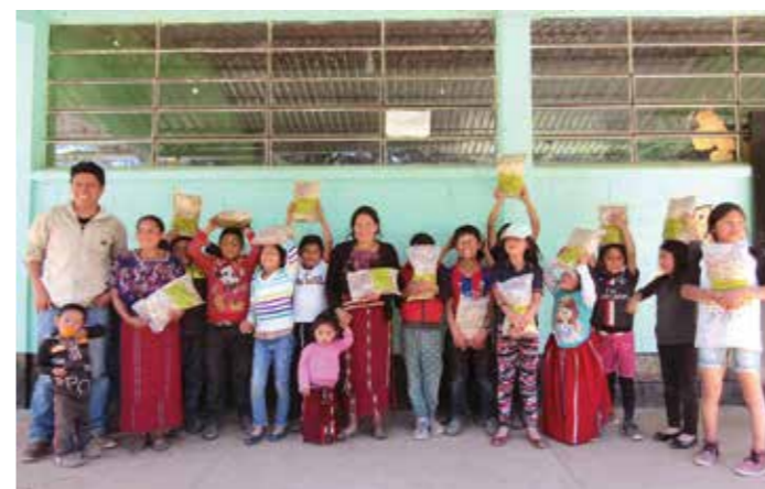
スープミックス配給の日/生徒や母親たちが教師とともに

FHグアテマラは、教育省ならびに保健省の方針に協力して学校給食のために野菜スープを提供し、危機的状況にある家庭の栄養状況の改善に寄与する働きをしていました。しかし新型コロナの影響による休校で、学校で出される軽食が唯一のまともな食事だった子どもたちは深刻な状