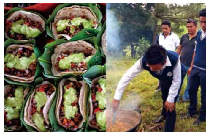
スープミックスで作ったタコス（学校給食）と調理する学生⑥

況に立たされていました。そのため、学校で提供する予定だった家庭に配給することとし、2021年10月から各生徒の家庭に約2週間分が配られています。