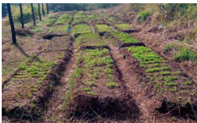
YFPの農場の一部、みんなで開墾してよい農地になりました。

2021年は前年に続き、トマト、玉ねぎ、紫玉ねぎ、レタス、ピーマン、とうもろこし、ピーナツなどを植えました。またピーツに挑戦し、良い収入を得ることができました。農業技術としては水やりを軽減できる新しい畝の作り方(水やりがいつも課題です)やコンパニオン・プランツ(お互いの栄養素を補完するものを一緒に植えること)などを新しく取り入れました。