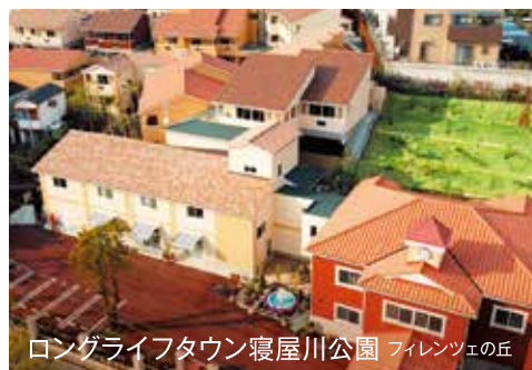
ロングライフタウン寝屋川公園 フィレンツェの丘